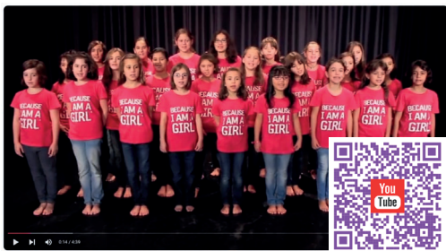
BECAUSE I AM A GIRL - Versión española - Los Fantásticos

Porque Soy una chica es un movimiento internacional de la ONG Plan. El objetivo de la campaña es promover los derechos de las niñas y sacar a millones de ellas de la pobreza en todo el mundo. La campaña se centra en la falta de igualdad con que se enfrentan las niñas